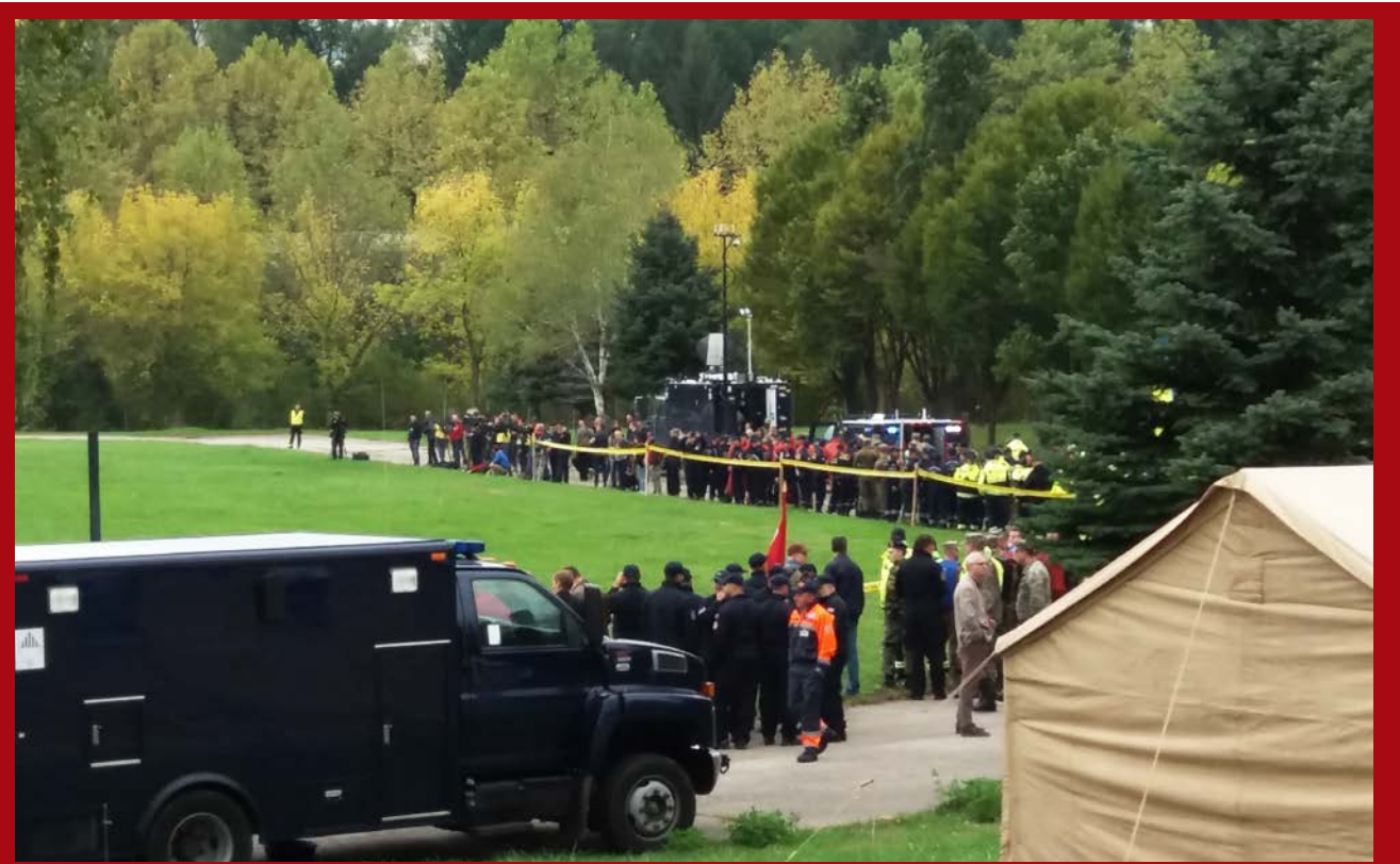
NATO vježba je otvorena u bazi koja je bila uspostavljena u Kampusu Univerziteta u Tuzli. Otvorena je simulacijom evakuacije nastradalih osoba u saobraćajnoj nesreći na nepristupačnom i miniranom području.