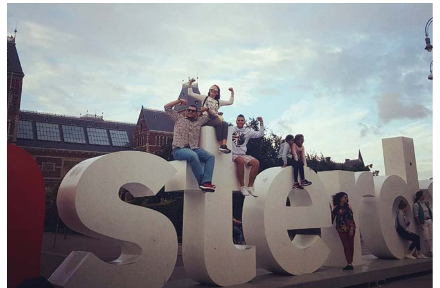
Amsterdam - jedna od najprivlačnijih evropskih destinacija

Tada smo imali još četiri dana do isteka naše InterRail karte i veliku dilemu gdje da ih potrošimo - Beč ili fast tour kroz više talijanskih gradova do kojih bi se odvezli Azurnom obalom. Ova druga opcija se učinila primamljivijom. Čekao nas je dug put od