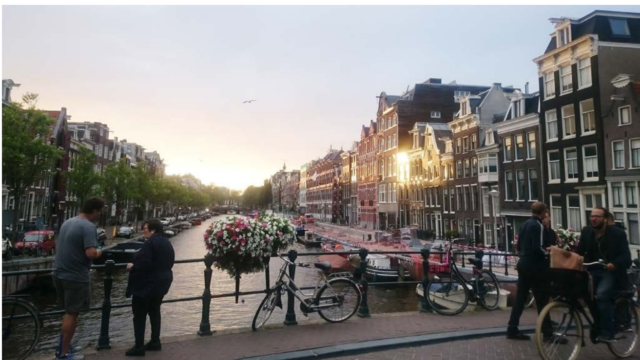
Svaki evropski grad nudi priču koju morate doživjeti

Evo ideja kako da putujete svijetom besplatno ili vrlo jeftino: Volontirajte na putovanju. Ne biste vjerovali, ali mnogo je programa u svijetu koji vam nude volontiranje u okviru nekih projekata. Bilo da volite raditi sa starim ljudima, kreativni ste i stvarate male izume, usavršavate svoj jezik ili ste dobri u organizovanju određenih događaja, nije ni važno! Bitno je samo da odete na Google i potražite priliku za sebe. Osim što ćete oputovati, postoji mogućnost da za dobro obavljen posao dobijete i novac.