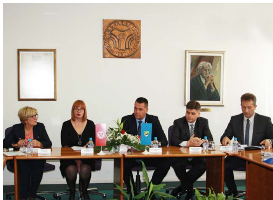
Optimistični stavovi Vlade TK i menadžmenta Univerziteta

Dekani su se složili, ali i glasno kazali da je podrška Vlade Univerzitetu i praktično vidljiva, te i sami predložili nove projekte čijom bi se realizacijom osavremenili uslovi rada na fakultetima. Vlada TK će, u skladu sa mogućnostima, imati sluha za realizaciju tih projekata, ali je obnova Kampusa strateško opredjeljenje vlasti, jer će se implementacijom ovog projekta riješiti većina problema svih fakulteta Univerziteta u Tuzli.