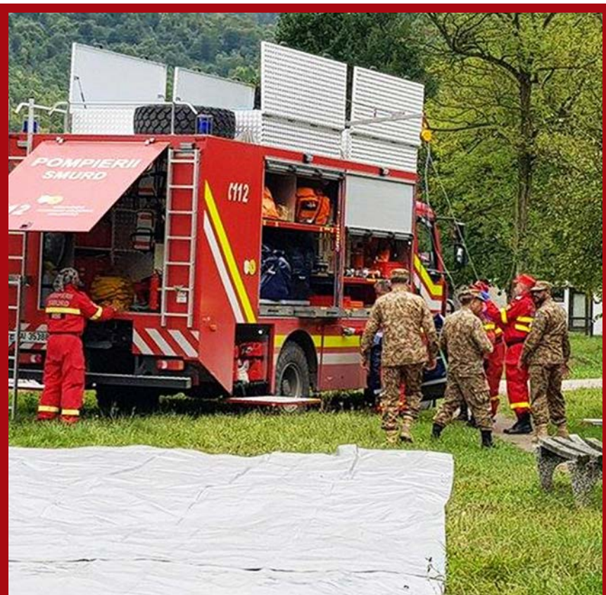
U vježbu su osim međunarodnih pripadnika NATO snaga bile uključene i lokalne službe zaštite i spašavanja