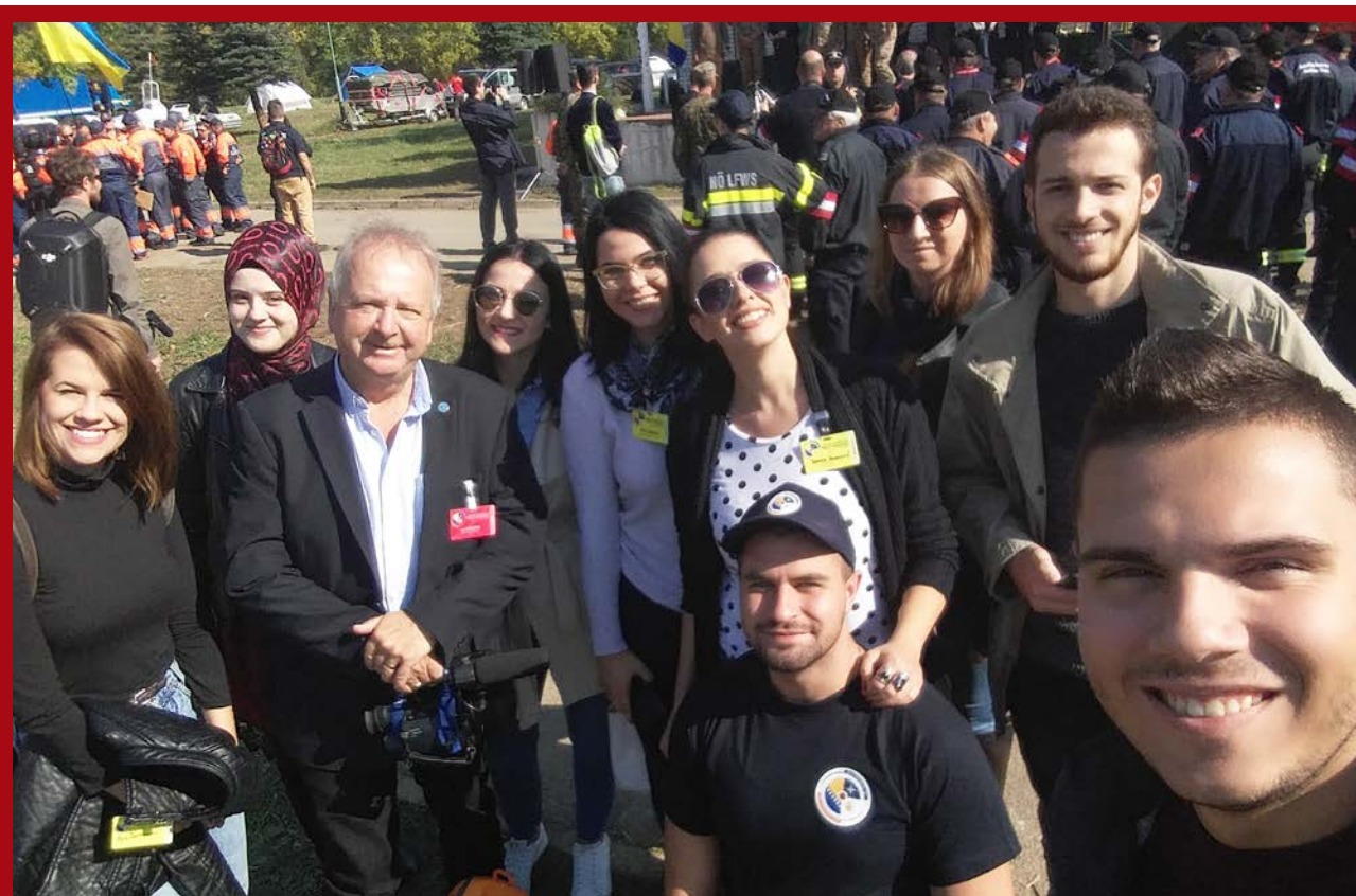
Studenti Odsjeka za žurnalistiku Filozofskog fakulteta Univerziteta u Tuzli sa jednim od edukatora programa izvještavanja i komunikacije u kriznim situacijama