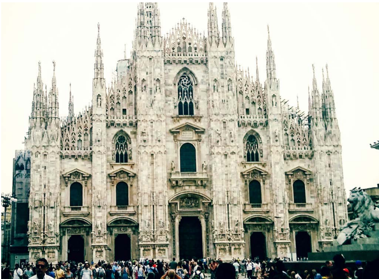
Raznolikost evropske kulture

va upoznavati grad, zavirivati u meni neotkrivene dijelove, jesti gellato na obali Jadrana... - neprocjenjivo. Hm, mislim da mi je to druga omiljena riječ na ovom putovanju.