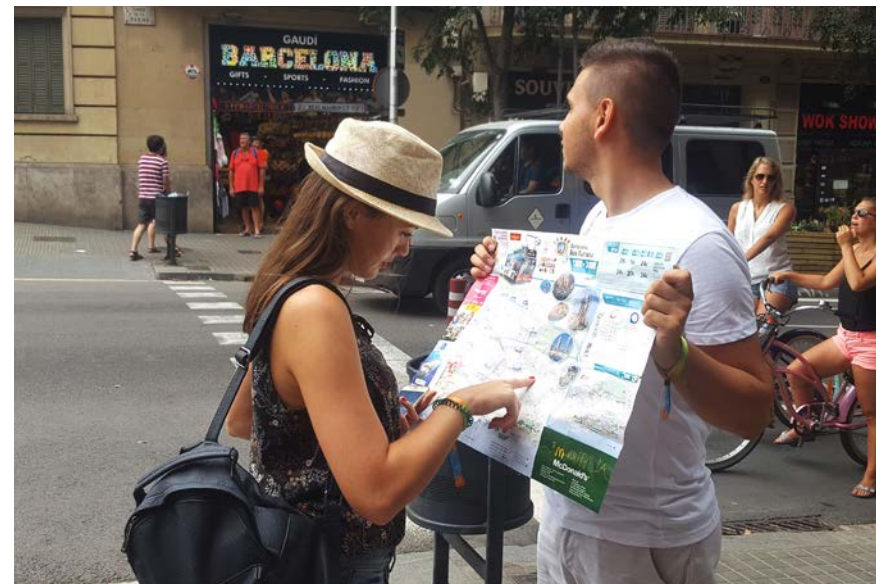
Za snalaženje u velikom gradu trebaju vam mape i druga pomagala

Nakon prehodanih skoro 200 kilometara i Bog zna koliko pređenih vozom, metroom i autobusom, ono za čime smo žudjeli bio je odmor. Fizički. A koje mjesto je bolje za odmor nego plaža! Sljedeća destinacija bio je krajnji jug Španije i San Pedro, selo pored mega luksuzne Marbelje. Još jedna neplanirana destinacija. Miris mora, nepregledne pješčane plaže i pogled koji je dosegao do Maroka i Gibraltara bili su savršena kombinacija. Nakon dva dana ljenčarenja i divljenja luksuzu koji nas je okruživao, bili