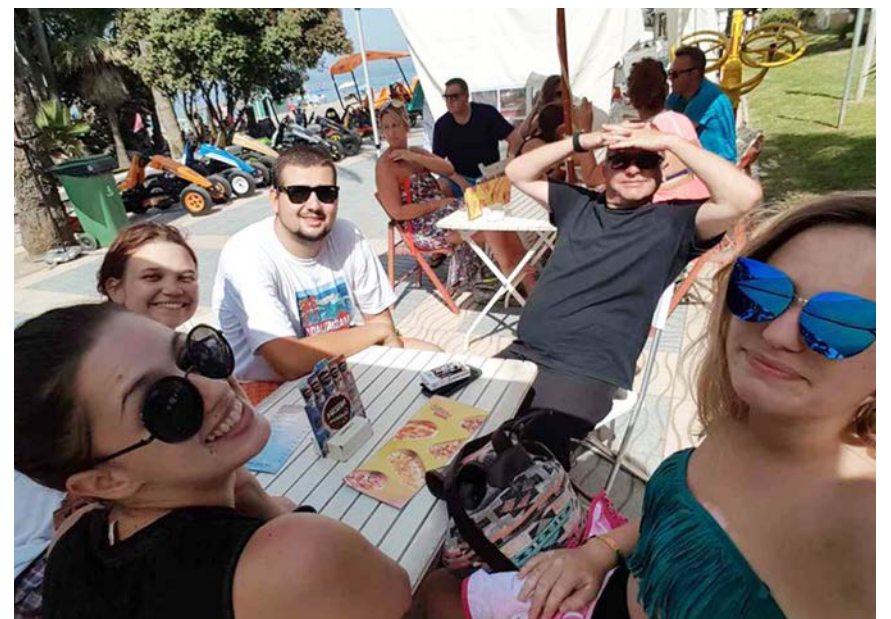
Svaki dan je bio nova avantura

Oslobodite se, znamo da znate pričati engleski jezik. Uopšte nije