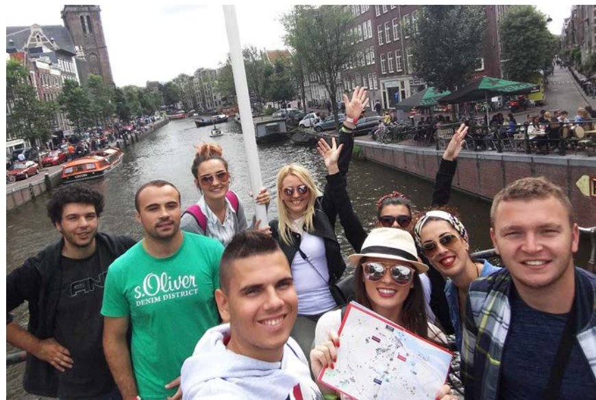
Nova poznanstva i nove avanture