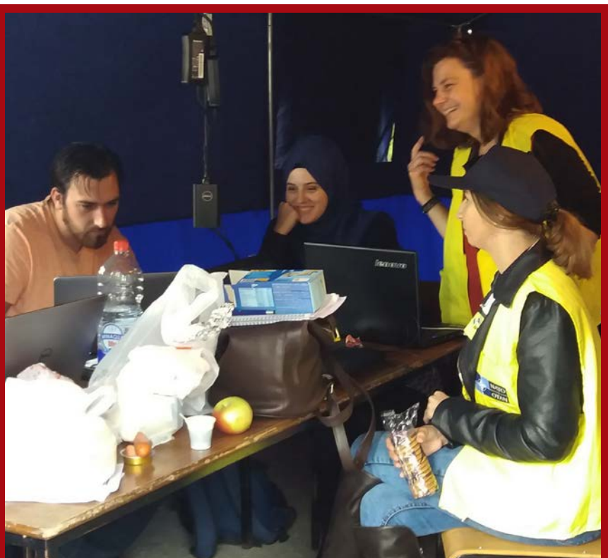
Studenti druge, treće i četvrte godine studijskog odsjeka Žurnalistika spremno su odgovorili svim zadacima koji su se pred njima našli.