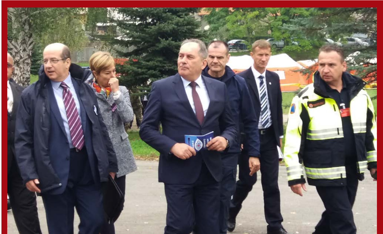
Ministar sigurnosti BiH Dragan Mektić obišao je bazu, pozdravio učesnike vježbe i poelio sretan rad svim akterima ovog izuzetno bitnog događaja za Bosnu i Hercegovinu.

Studenti su u okviru svojih zadataka, pored dvodnevne teorijske obuke, dobili priliku direktno na terenu prikupljati, procesuirati i prosljeđivati informacije do kojih su dolazili kao novinari najrazličitijih medijskih grupacija – od lokalnog, nacionalnog i međunarodnog nivoa izvještavanja.