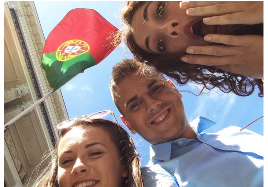
Bili smo u Portugalu - evropskom Brazilu

Hercegovini, rečenice koje ste upravo pročitali neka vas motivišu da svaku priliku koja se nađe ispred vas prihvatite sa velikom