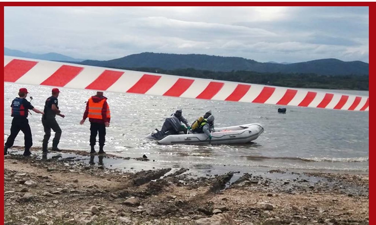
Studenti su imali priliku prisustvovati simulaciji kriznih situacija usljed poplava i spašavanja stanovništva iz poplavljenih područja