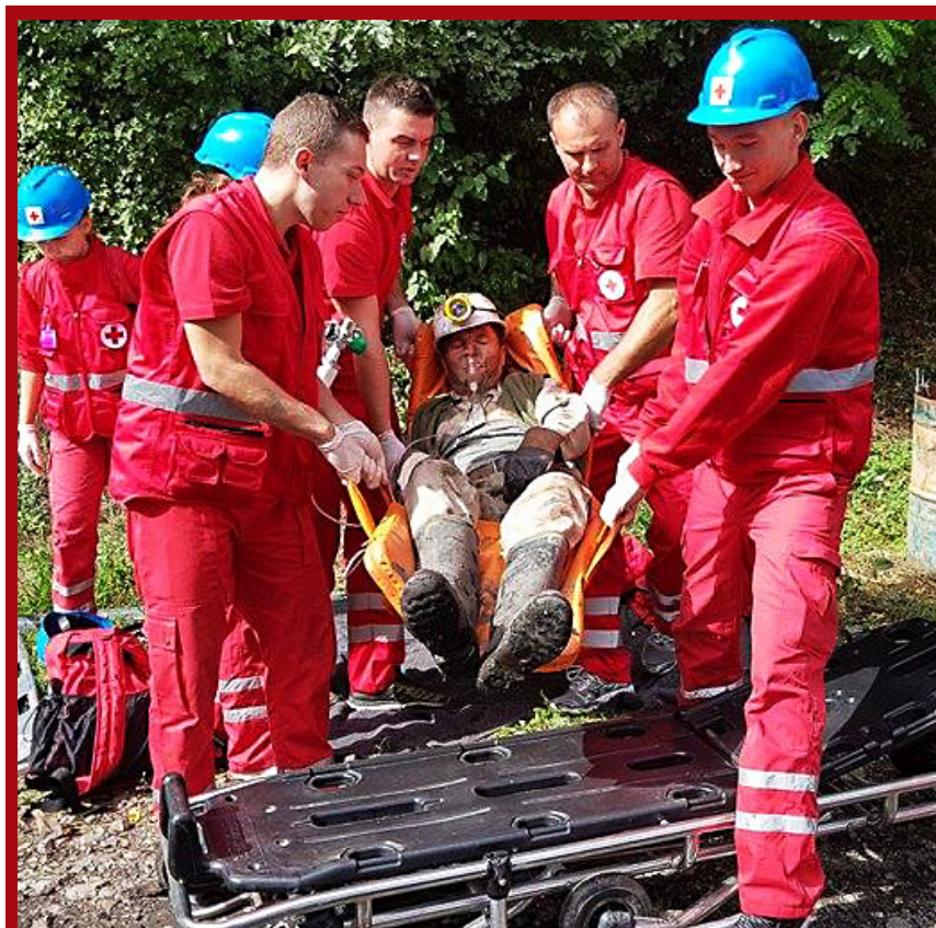
Autentične scene na različitim dijelovima Tuzlanskog kantona doprinijele su da vježba bude još ozbiljnija i kvalitetnija.