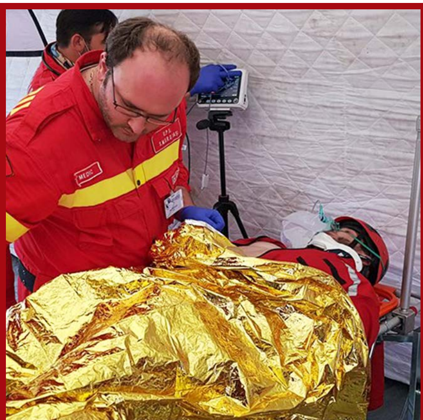
Simulacija spašavanja unesrećenih lica iz kriznih područja i pružanja prve medicinske pomoći