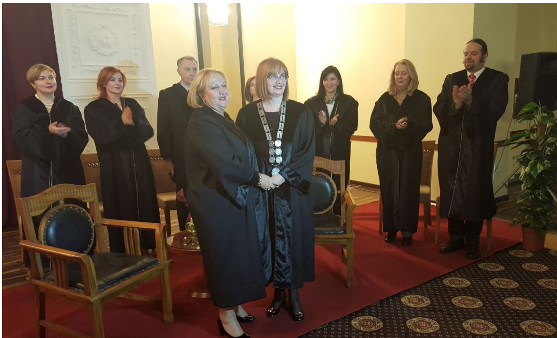
Momenat primopredaje dužnosti rektora Univerziteta u Tuzli