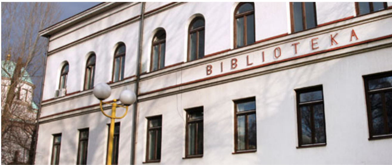
Gradska i Univerzitetna biblioteka u Tuzli se ne može pohvaliti velikim izborom univerzitetske literature

Sve u svemu, mnogostruki problemi u ovoj oblasti s kojom se suočava Tuzla kao „univerziteti grad“ zahtijevaju mnogo posla i uređenja na svim nivoima da bi studenti, u konačnici, imali barem opejije dostojne studenata jednog univerzitetskog grada.