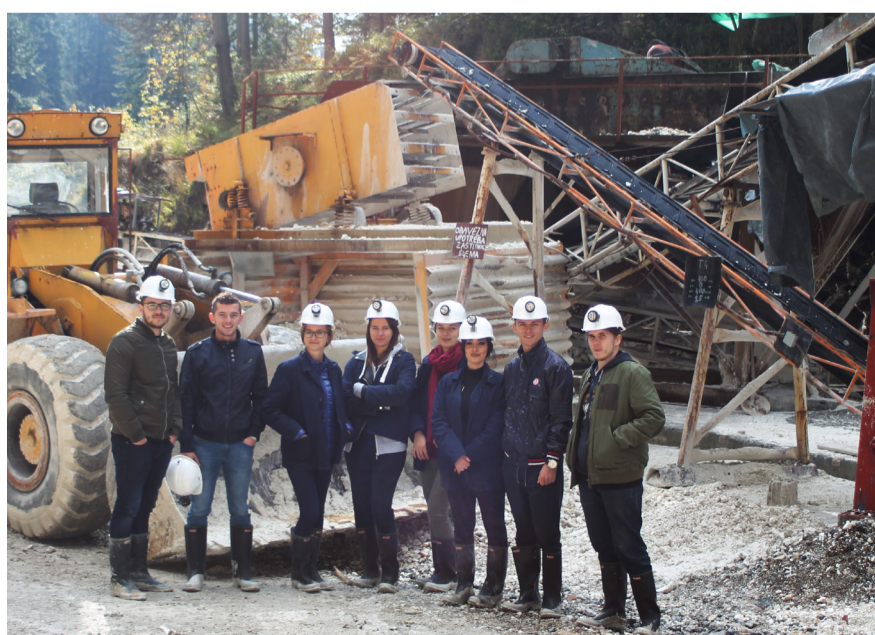
Studenti izuzetno zadovoljni realiziranim stručnim izletom