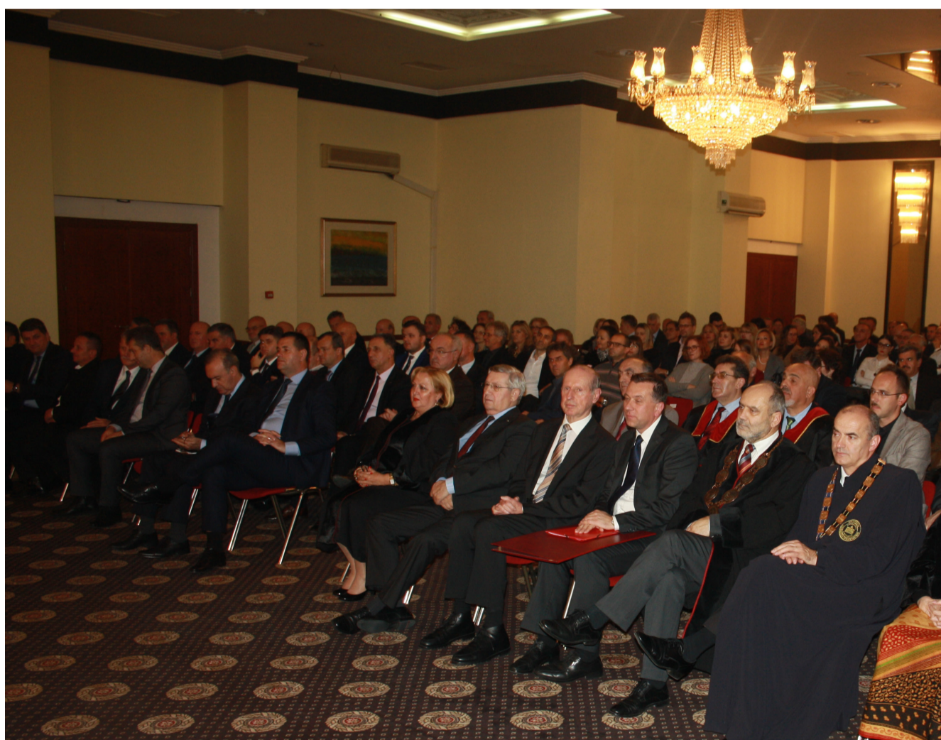
Prepuna Kristalna dvorana hotela Tuzla zvanica iz akademskog i političkog vrha Tuzlanskog kantona i BiH