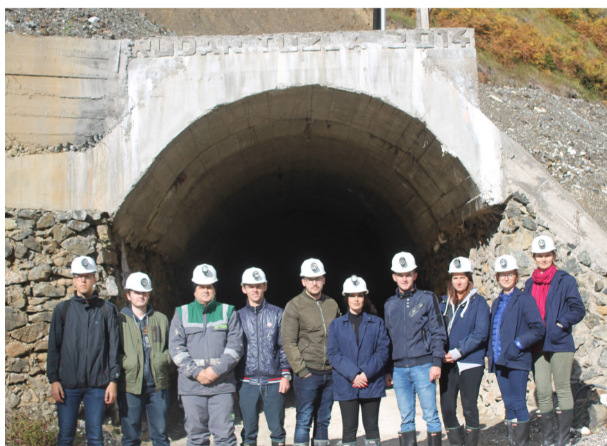
Budući inženjeri pred ulazak u okno

Nakon obilaska rudnika studenti su istaknuli kako su zadovoljni ovim vidom nastave i nadaju se da ovakvih radnih posjeta u budućnosti neće nedostajati.