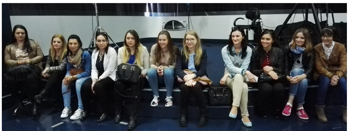
Svake godine studenti Odsjeka za žurnalistiku Univerziteta u Tuzli posjete Al Jazeera Balkans