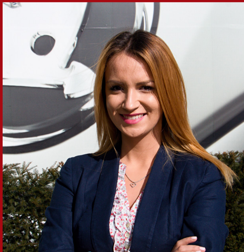
„Studenti su najjače oružje i svijetla tačka naše države“

- Drago mi je da mogu reći da Mašinski fakultet u Tuzli, u vri-