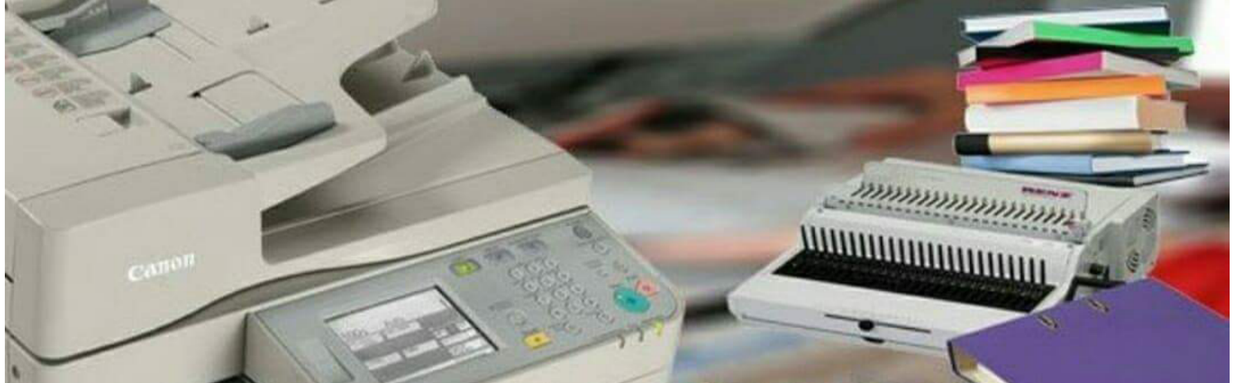
Kopirnice i trgovci skriptama i kopiranim/rabljenim knjigama su najčešća destinacija studenata pri potrazi za univerzitetkom literaturom

Sa ovakvim „stanjem na terenu“ gdje evidentno studenti ne obilaze biblioteke niti potrebnu literaturu