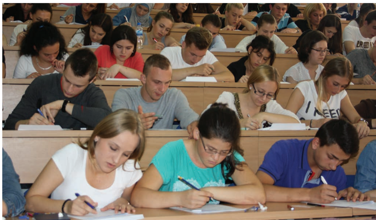
Studenti Univerziteta u Tuzli nerijetko nakon upisa studij nastave na jednom od partnerskih univerziteta u Evropi

„Naši alumniji nam mogu ponuditi najbolje informacije o tome kako možemo unaprijediti naše studijske programe kako bi naši studenti na tržištu rada bili konkurentniji i prepoznatljiviji i mislim da se ta veza u svakom slučaju treba jačati i podići na neku višu razinu, kako bismo imali daleko bolje povratne informacije od naših svršenih studenata,“ kaže prorektorica Nikolić.