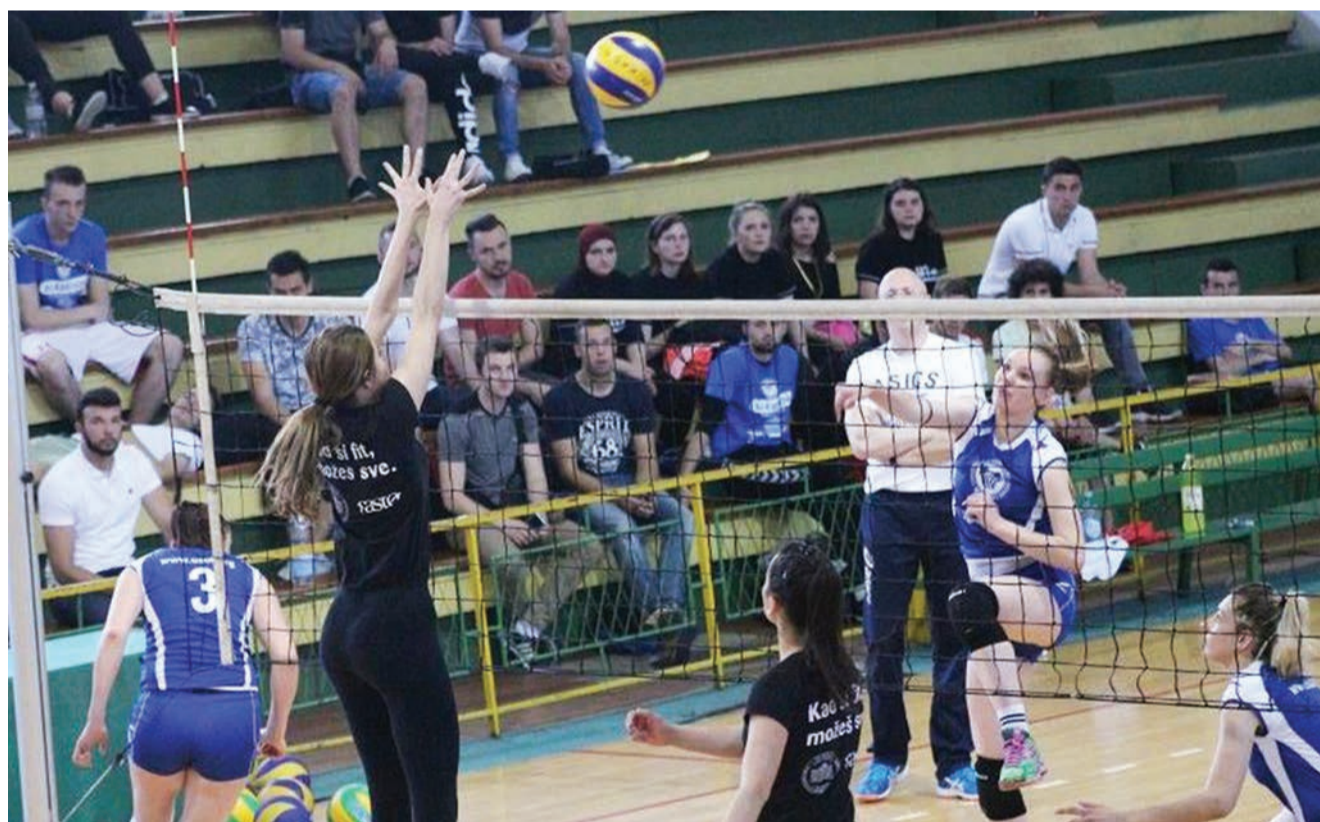
U finalnom meču odbojkašica pobjedila je ekipa Univerziteta u Tuzli