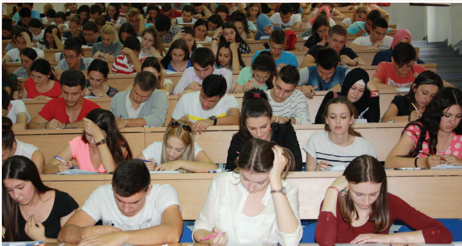
Detalj sa prošlogodišnjeg prijemnog ispita na jednom od fakulteta Univerziteta u Tuzli