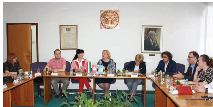
Vlada Mađarske odobrila je 55 stipendija za studente iz BiH

Do tada, preporučujemo vam ovo on line izdanje i želimo uspjeh na predstojećim završnim i prijemnim ispitima.