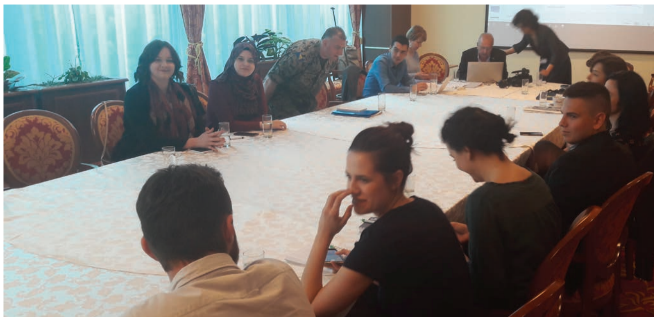
Studenti će u okviru vježbi izvještavati o krizi i imati ulogu da povezuju ljude iz područja pogođenih krizom.

Cilj vježbe je provjera kapacitiranosti država za otklanjanje posljedica katastrofa i uzajamnu pomoć, te kreiranje protokola po kome će se u budućnosti djelovati u slučaju katastrofa. Pregovori i dogovori za