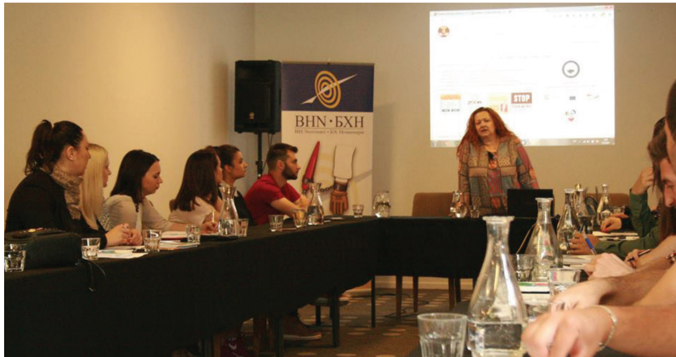
Tema Novinarske akademije bila je izvještavanje o različitostima i doprinos medija jačanju mira, tolerancije i stabilnosti u BiH.

Od tehnika i metoda istraživanja tema u vezi sa jačanjem mira, tolerancije i stabilnosti u postkonfliktnim društvima; bosanskohercegovačkog