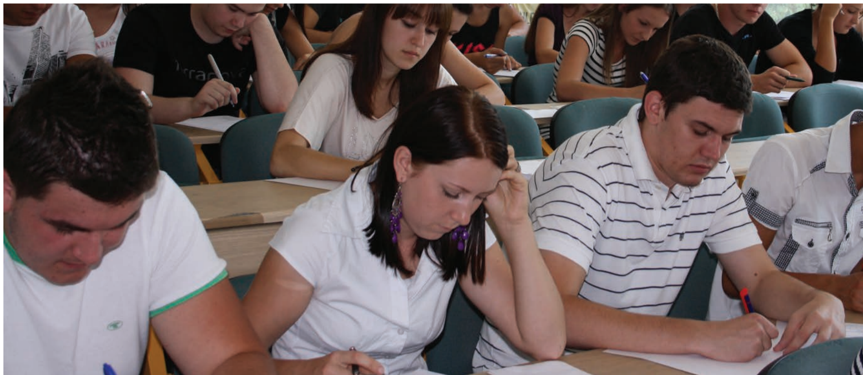
Svi studenti će dobiti ovjeren duplikat svog prijemnog ispita

Kada je u pitanju odabir kandidata, on će se raditi na osnovu ostvarenog broja bodova prema općim i pojedinačnim kriterijima