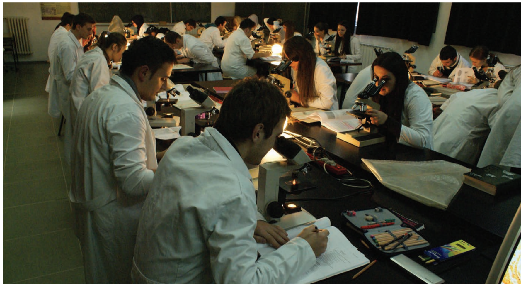
Univerzitet, uprkos brojnim izazovima, studentima nudi savremenu laboratorijsku, praktičnu i stručnu obuku za buduća zanimanja svih profila

S druge strane, za razvojnu strategiju i upisnu politiku na Univerzitetu u Tuzli bitna je kontinuirana saradnja sa osnivačima, odnosno kantonalnim institucijama vlasti, sa kojima se svake